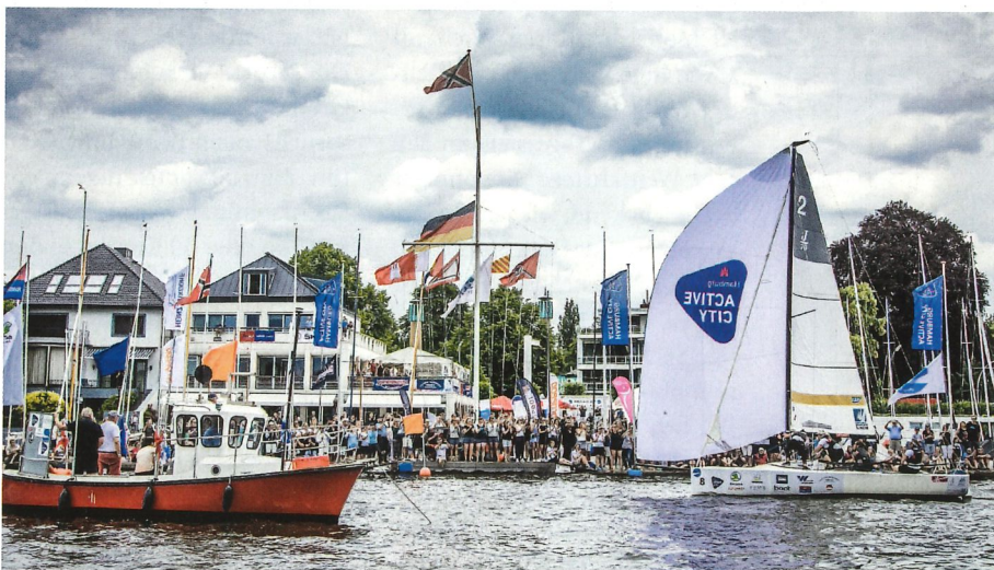
Ein jubelndes Heimpublikum empfängt die NRV Pulvermädel im Ziel, das direkt vor dem NRV aufgebaut war.

Mit einer Reihe an Sonderpreisen fördert der Cup die Vielfalt der Seglerinnen und schafft ein Forum für alle segelnde Frauen, ob Fahrten- oder Freizeit, Anfänger- oder Profissegerin. So benannte die Jury das HSC Women's Team für seinen engagierten Social Media Auftritt inklusive einem leidenschaftlich bespielten YouTube-Channel, auf dem sie regelmäßig Segel- und Trainingstipps geben, zum Sieger des Medienpreises. Als Team der Mitte gewinnen die Lady Lions den neugeschaffenen Mittelpreis von der Mittelmanswerft.